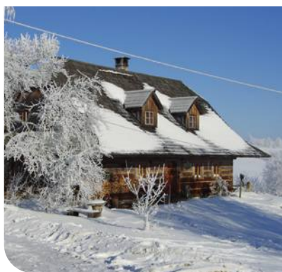
SÍDLO ISOLENA V ČESKÉ REPUBLICE