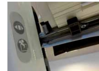
Zajištění mycí polohy