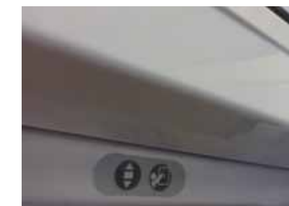
Tlačítko na ovládání okna a mycí polohy

RotoComfort i8 je díky revoluční patentované technologii první elektricky ovládané výklopné/kyvné střešní okno. Integrovaná mechanika na rámu křídla zajišťuje neomezený výhled, volný přístup k oknu a pohodlnou obsluhu. Samozřejmostí je celoobvodové kování a zateplovací blok, proto toto okno nabízí vynikající tepelně-technické parametry. Zákazník jistě ocení polohu pro mytí skla, dešťový senzor či možnost nouzového zavření okna v případě výpadku elektrického proudu. Montážníka naopak osloví jednoduchá montáž. RotoComfort i8 vyrábíme v nadstandardních rozměrech i v trojskle.