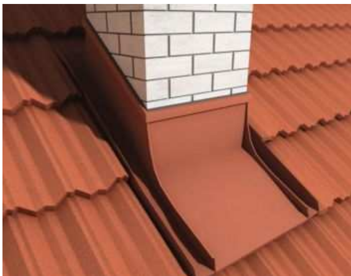
Montáž komína - krok 4