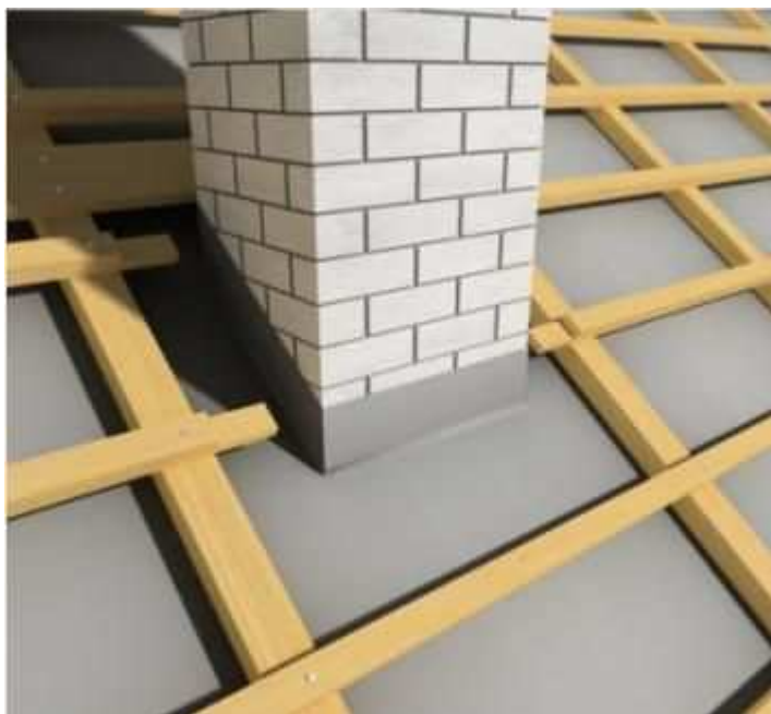
Montáž komína - krok 1