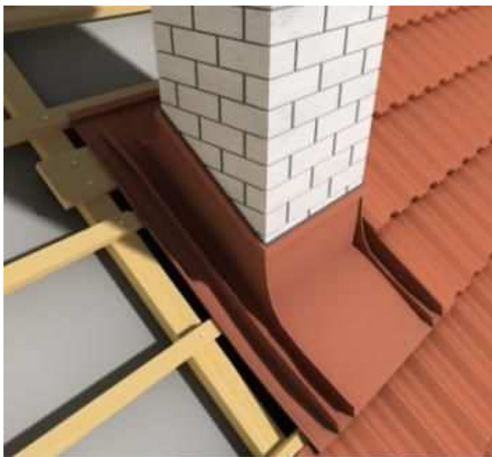
Montáž komína - krok 3