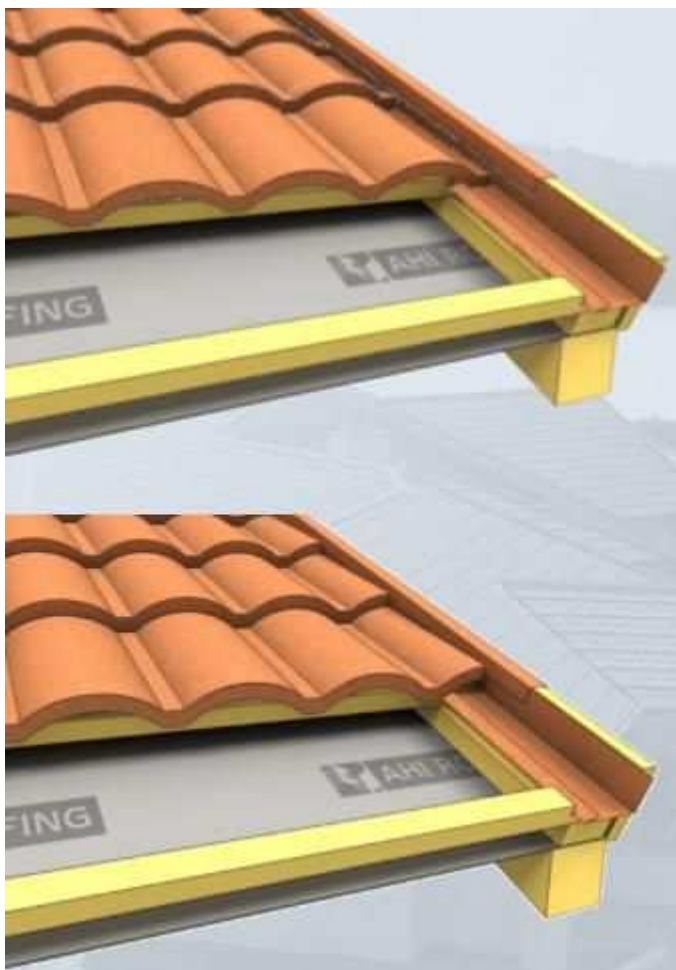
Montáž štítu - profil Římská

Provedení štítového detailu zachycuje následující obrázek.