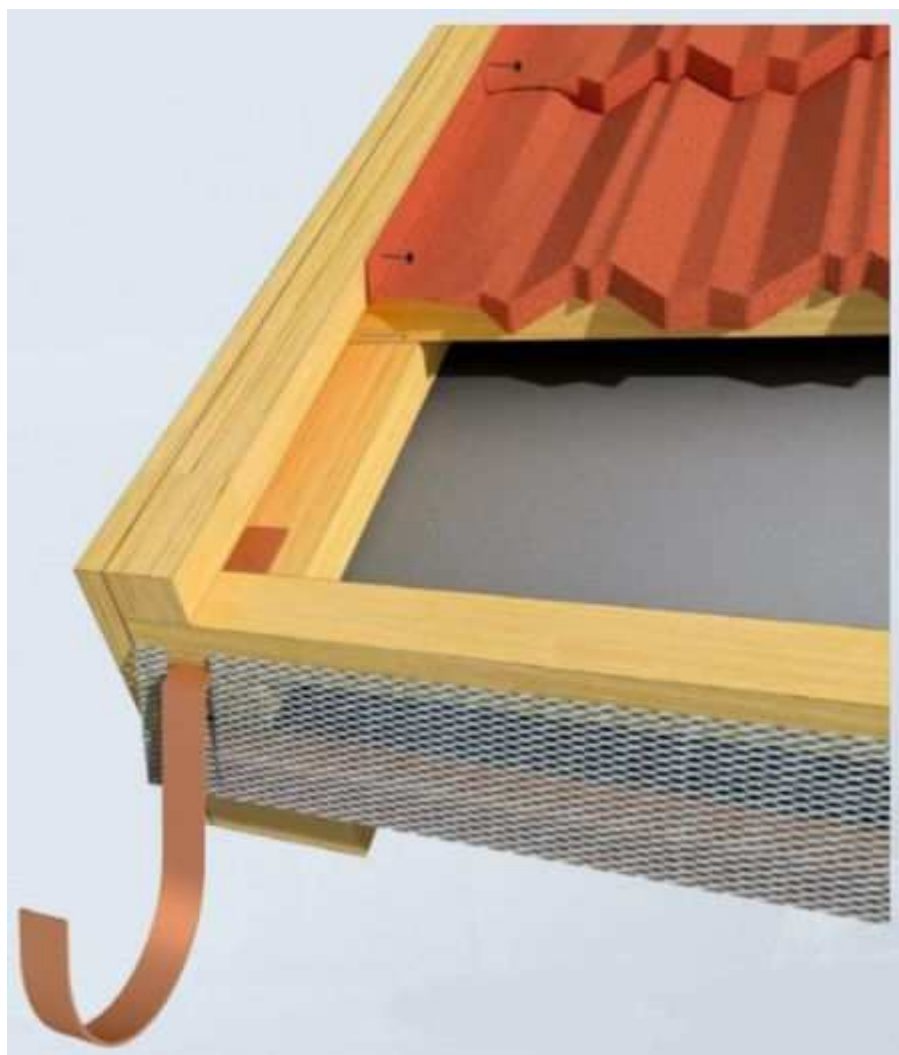
Montáž štítu - celkový pohled

Celkový pohled na detail štítu zachycuje následující obrázek. Povšimněte si ohybů provedených na střešních šablonách a způsobu, kterým jsou ohyby střešních šablon přikotveny ke štítové lati.