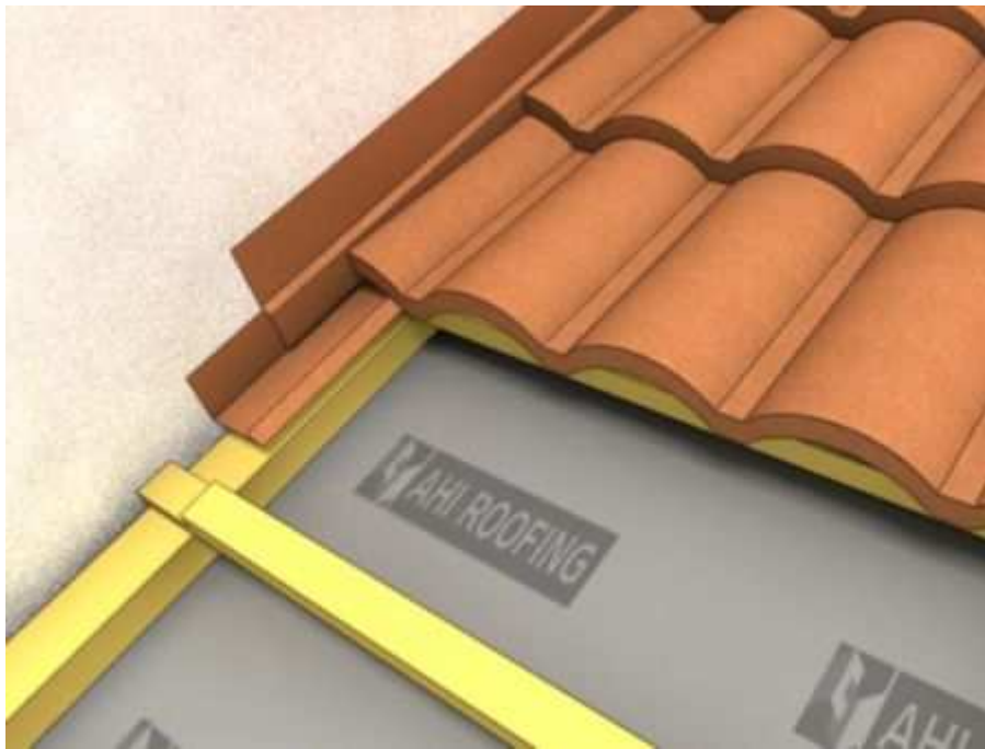
Montáž lemu zdi - profil Římská