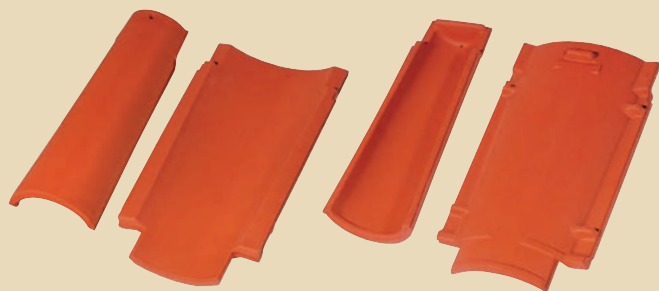
Velký prejz kůrka + hák – líc